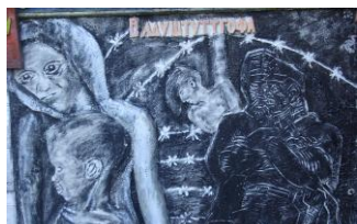
Фотографии Сада памяти выполнены обучающимися 6 класса